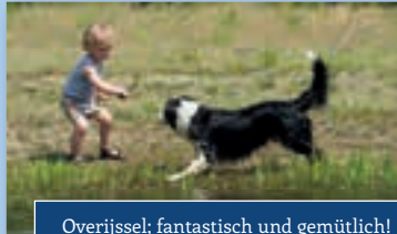
Overijssel; fantastisch und gemütlich!