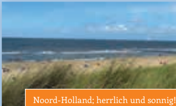
Noord-Holland; herrlich und sonnig!