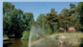
Limburg; unvergesslich und schön!