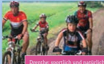
Drenthe; sportlich und natürlich!