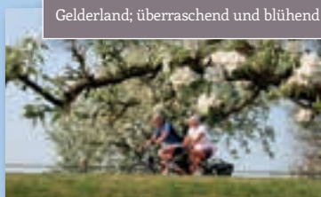
Gelderland; überraschend und blühend!