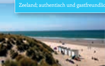
Zeeland; authentisch und gastfreundlich!