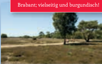
Brabant; vielseitig und burgundisch!